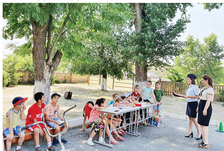
ОМВД. Безопасный детский отдых – общая задача, поэтому профилактическая работа с детьми продолжится и после закрытия летних площадок. Полицейские будут навещать ребят во дворах многоэтажных домов. Пресс-служба МВД по РСО-Алания.

Игры, соревнования, тематические конкурсы проводят в лагерях инспекторы ОГИБДД Отдела МВД России по Моздокскому району. В рамках акции «Общественный совет – детям» в гости к ребятам вместе с полицейскими приходят и представители Общественного совета при